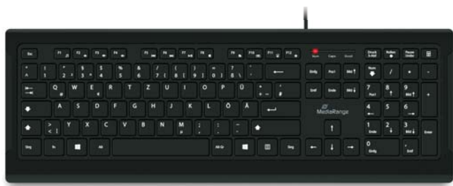
Keyboard layout shown on this manual may vary from product inside. Please see label on the packaging for details. This manual refers to all available layouts of this keyboard model.